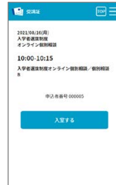
スワイプ後の画面