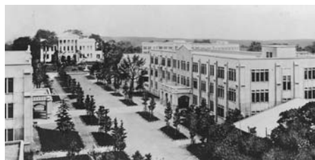
左:青山キャンパス(1932年) 右:青山キャンパス正門(1949年頃)