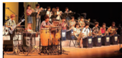
日本大学リズム・ソサエティ・オーケストラ