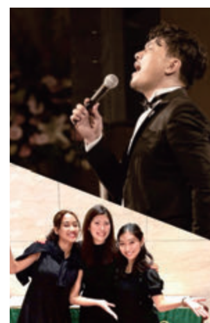
NOBU (Piano & Vo) with Gospel Singers