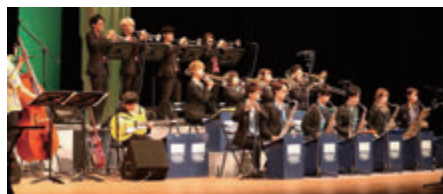
明治大学ビッグ・サウンズ・ソサエティ・オーケストラ