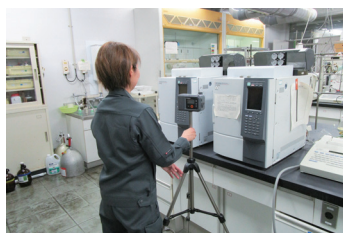
環境測定実施風景