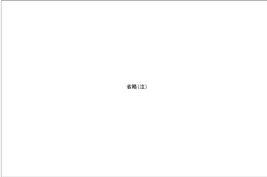
資料2 Issue attitudes of subjective (self-categorized) globalization losers versus winners